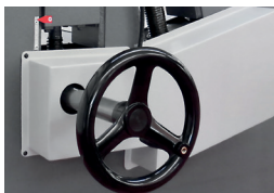
Ajuste manual rolo inferior